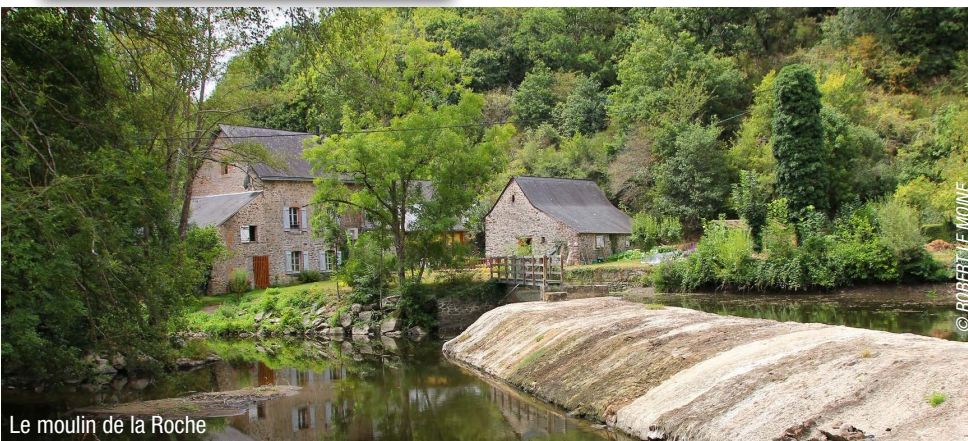
Le moulin de la Roche

RFN53-RF-009 - Le nom RandoFiche® est une marque déposée, nul ne peut l'utiliser sans l'autorisation de la Fédération française de la randonnée pédestre. © FFRandonnée 2020. FFRandonnée Mayenne