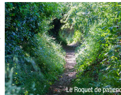
Le Roquet de patience

Etape 4-1 Traverser la D 32. Retour jusqu'au cœur du bourg par un long parcours boisé, itinéraire médiéval de Laval à Montsûrs rectifié au XVII e siècle par les seigneurs d'Hauterives. Traversée de la D 549. Succession de rues et allées entre maisons et jardins.