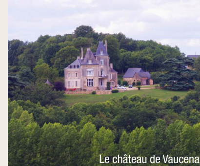
Le château de Vaucenay

au XVII e siècle et remanié au XIX e siècle. Celui de Grenusse date, quant à lui du XIX e siècle.